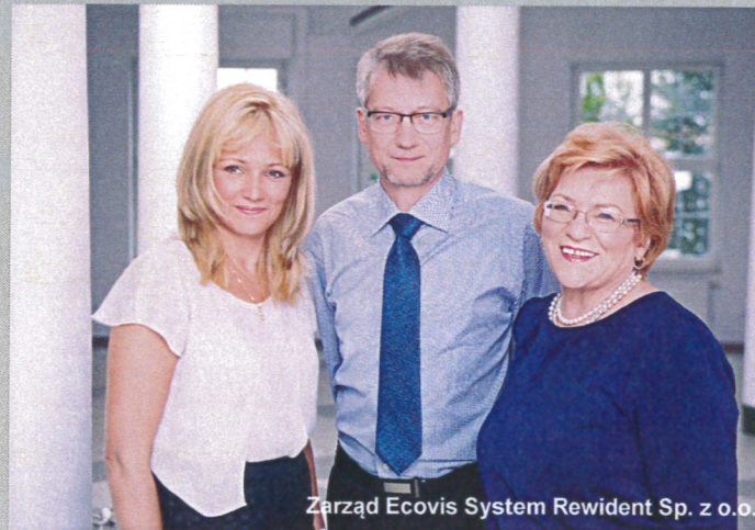
Zarząd Ecovis System Rewident Sp. z o.o.

Dążąc do spełnienia wymagań i oczekiwań Klientów dużą wagę przywiązujemy do współpracy z Klientem w oparciu o pełne zrozumienie procesów zachodzących w jego organizacji oraz świadczenie pomocy w bieżącej działalności.